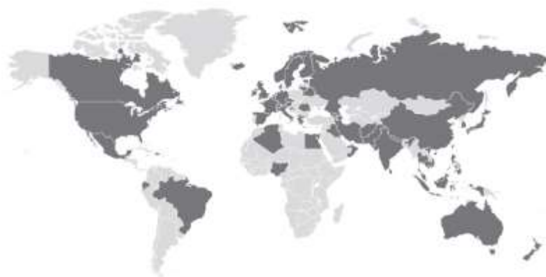
نقشه جهانی موارد کووید-۱۹ تأیید شده (۲۷ فوریه ۲۰۲۰)

مواردی از بیماری کووید-۱۹ در مسافران وارد شده به ایالت متحده مشاهده شده است. همچنین انتقال از انسان به انسان بین مخاطبین نزدیک این مسافران بازگشته از ووهان گزارش شده است. در ۲۵ فوریه، CDC مواردی از بیماری کووید-۱۹ را در فردی که بنا به گزارش‌ها سابقه مسافرت یا مواجهه با بیمار مبتلا به کووید-۱۹ نداشت، تأیید کرد. در حال حاضر، این ویروس در جوامع ایالات متحده شیوع ندارد.